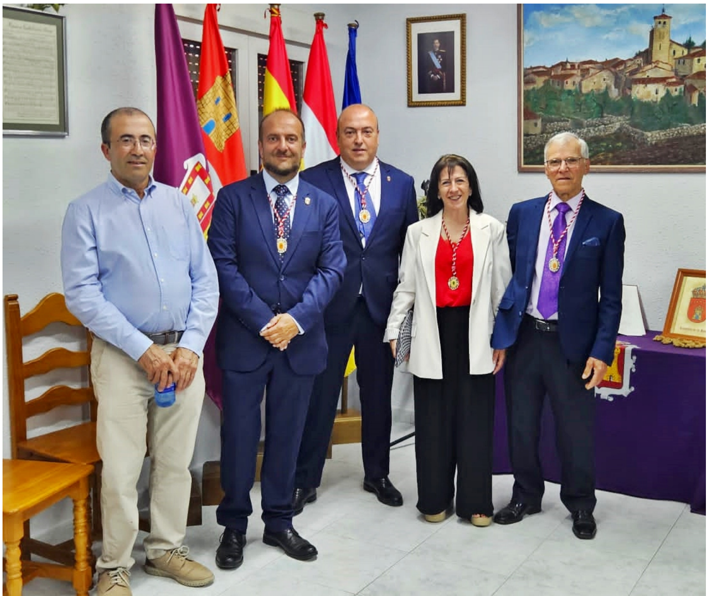
La Corporación Municipal y el Juez de Paz en la Romería de La Muela '25. (Ausente por enfermedad: Teniente de Alcalde)