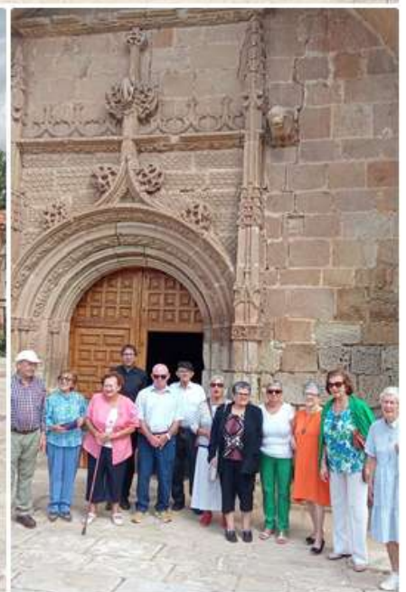
RECIBIENDO LA CAMPANA, PREPARANDO ALTAR CORPUS, PAELLA DE FIN DE CURSO, VINO ESPAÑOL DIA DE GRACIAS, CONCENTRACIÓN JUNIO CLUB CALIBRA ESPAÑA, MISA JUBILADOS 8 DE SEPTIEMBRE