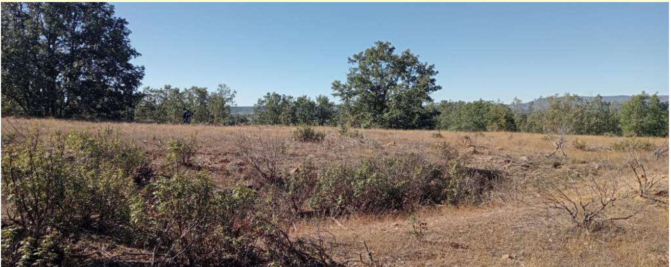
Aspecto actual en el lugar donde fue descubierto el árbol fósil en el término de Las Viñas

“Su hallazgo constituyó todo un acontecimiento, hasta el punto de que trascendió las fronteras locales. Fue en 1967 cuando, en Castrillo de la Reina, fue descubierto un impresionante árbol fosilizado. Un roble de nueve metros de longitud, 1,5 de anchura y unas 25 toneladas de peso. Su antigüedad, apabullante: en torno a los 120 millones de años, periodo mesocretácico, era Secundaria. Una joya, una maravilla paleobotánica. «Del reino vegetal, es el ejemplar fósil más impresionante que he conocido. Ni siquiera recuerdo haber visto algo similar en reproducciones fotográficas de libros especializados», se felicitaba José Luis Reoyo, uno de los científicos que avalaron el descubrimiento. La zona en la que emergió el fósil vegetal era conocida en la comarca como cementerio de árboles, como pudo comprobarse después, cuando fueron apareciendo otros ejemplares.”