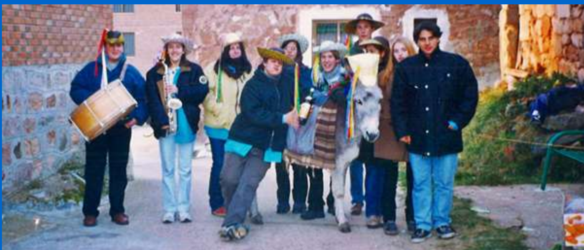
Quintos 98 – XXV aniversario