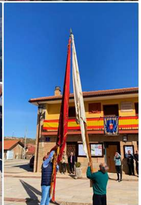
ATAVIADOS EN LA ROMERÍA DE LA MUELA, CRISTO RESUCITADO, PROCESIÓN DE LA ROMERÍA, VUELTA CICLISTA A ESPAÑA 2023, QUITANDO EL MANTO A LA VÍRGEN, CHOQUE DE PENDONES EL DOMINGO DE RESURRECCIÓN